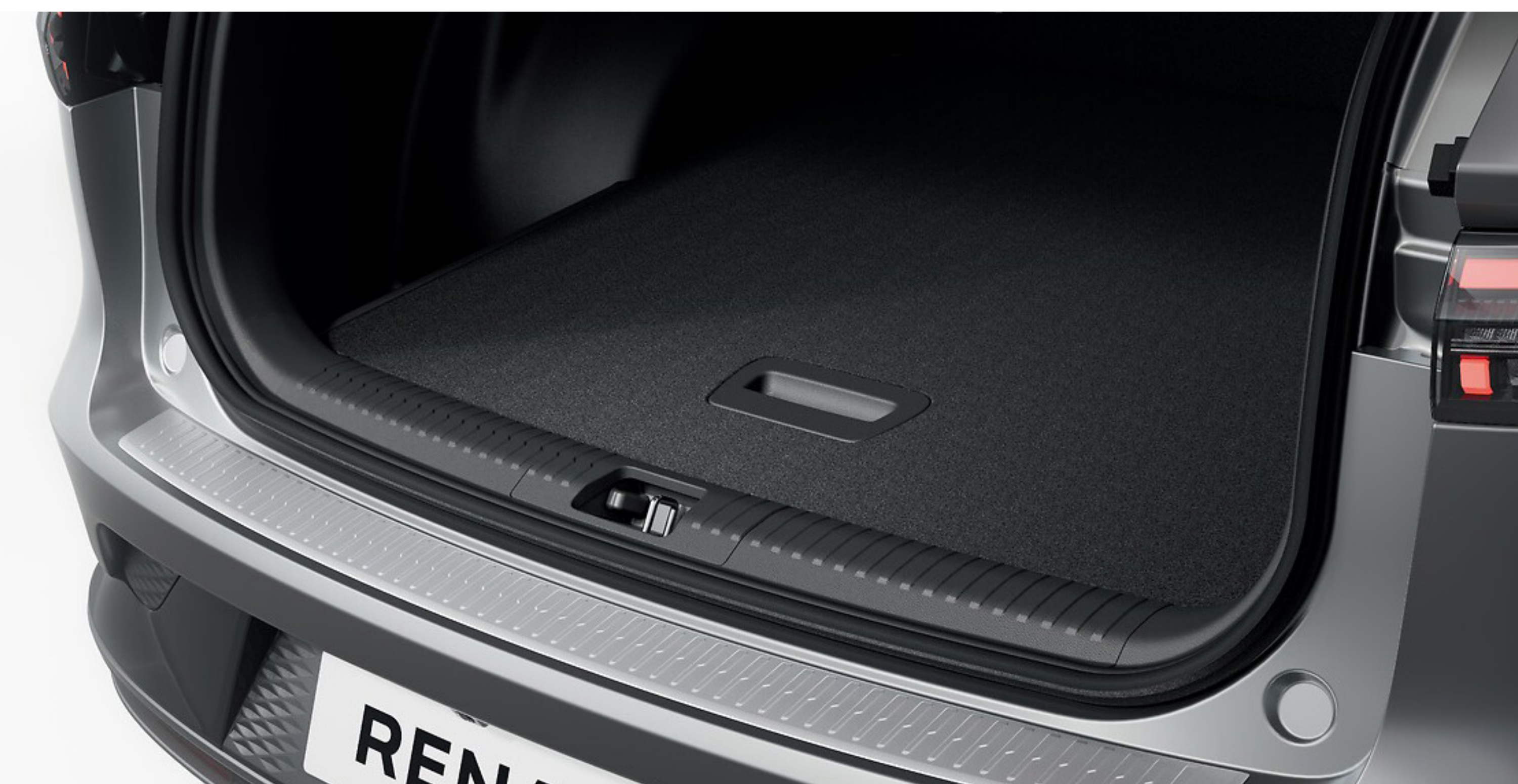
protector baúl GD KO ref.:849P50471R

Protector de entrada del baúl que protege tu vehículo de los daños provocados por los arañazos cotidianos que se producen al cargar y descargar el equipaje y proporciona un efecto exterior lujoso.