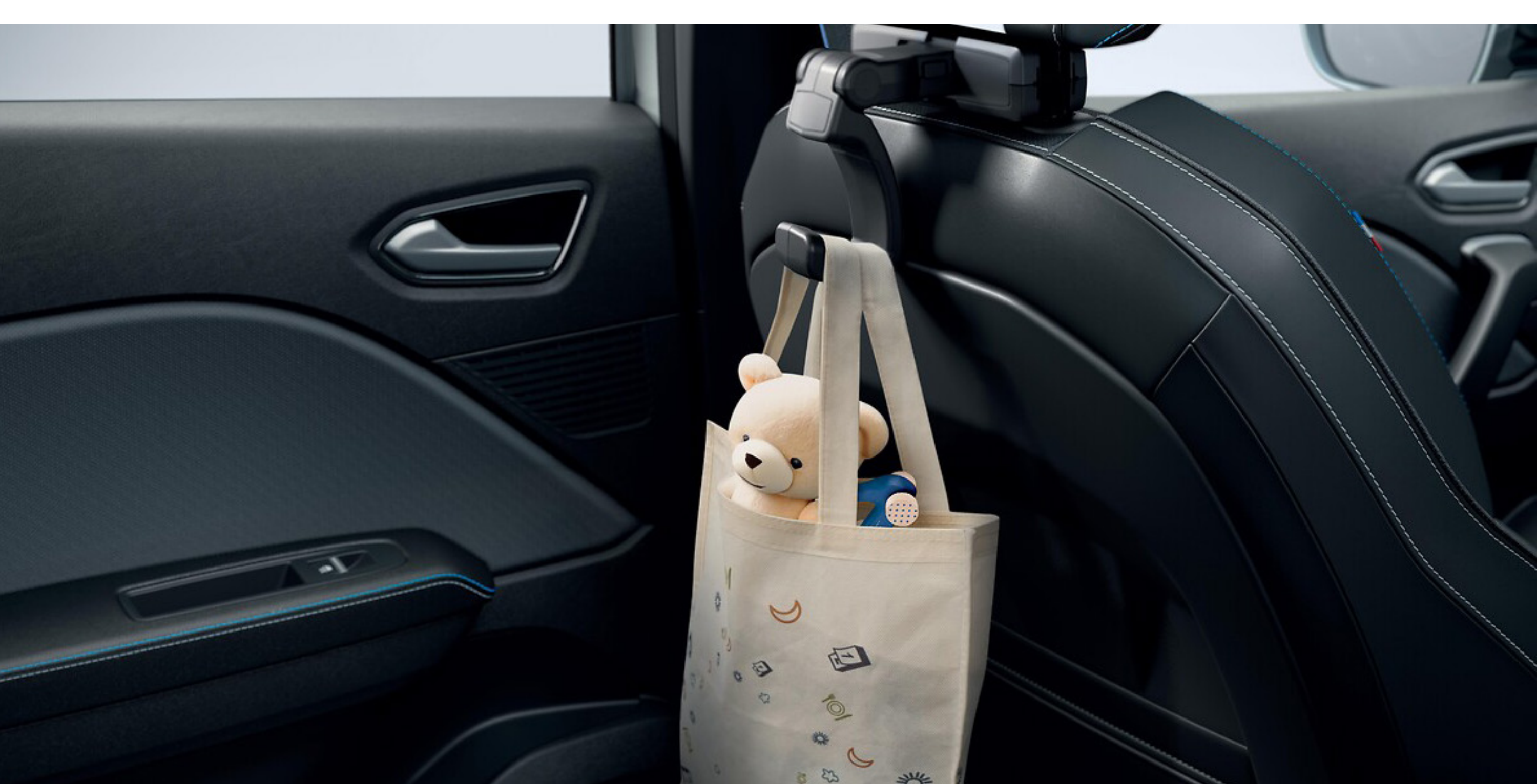
soporte multifuncional en apoyacabezas* ref.: 7711785944

El soporte multifuncional en el apoyacabezas te permite llevar tus accesorios a cualquier lugar, además, sirve para acoplar otros elementos al interior de tu vehículo como la mesa tipo avión.