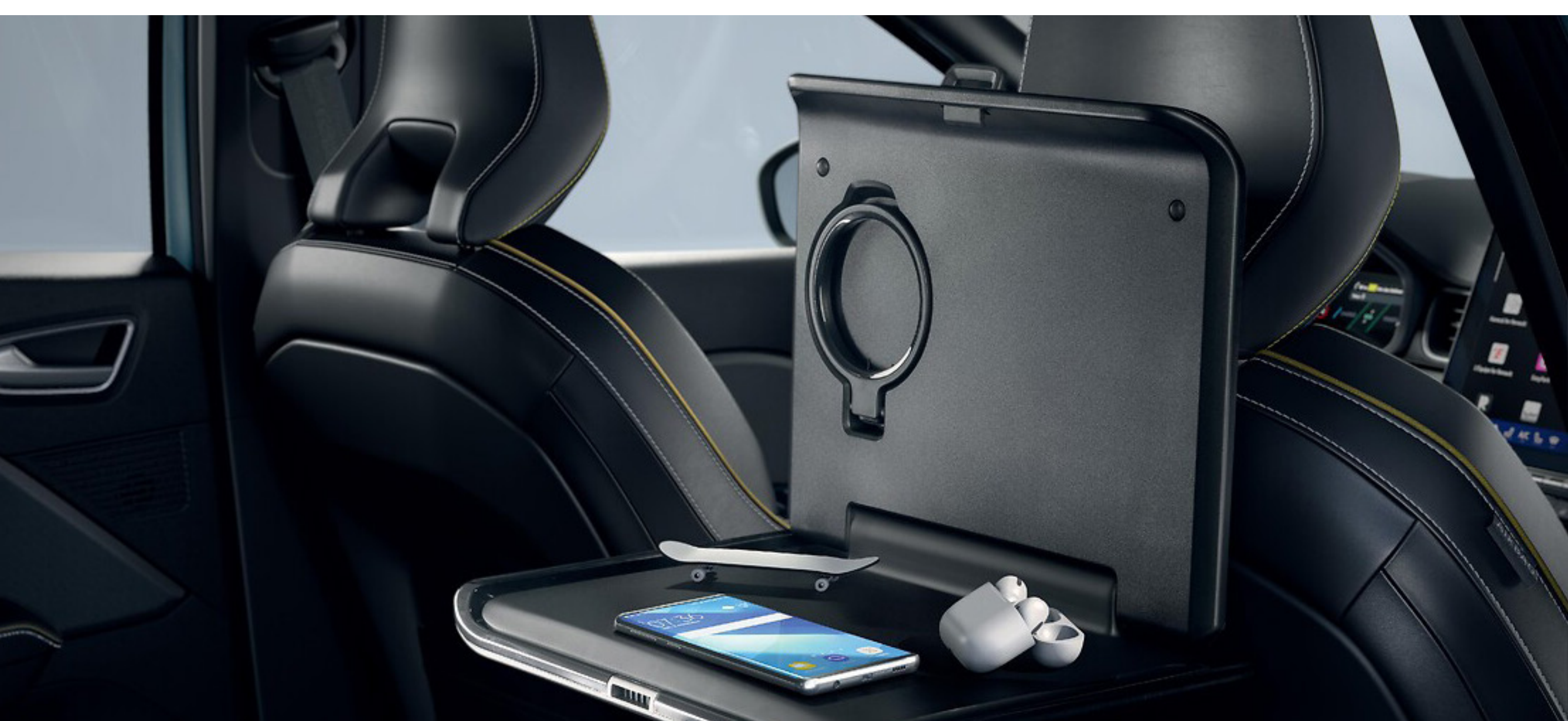
mesa tipo avión** ref.: 7711785947

Mesa trasera tipo avión, útil para los pasajeros de atrás y sobre todo si son niños. Cuando no se utiliza se puede plegar sin ocupar espacio e incluso puedes utilizar esta bandeja trasera multifuncional para prepararte cómodamente un café.