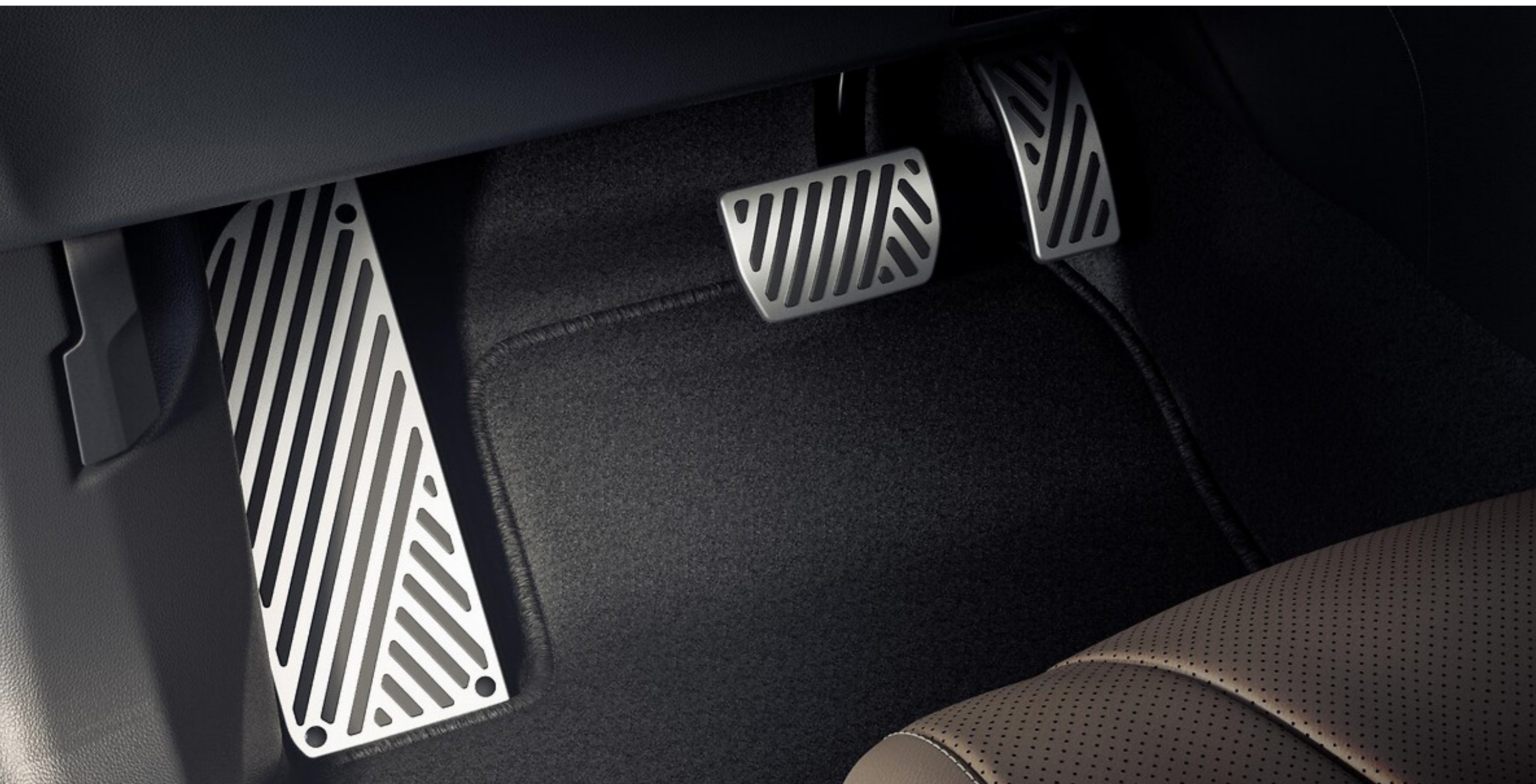
kit pedales deportivos GD KO ref.: 465314320R

Pedal deportivo premium con diseño plateado y goma. Seguridad sin resbalones, mejorando aún más el interior.