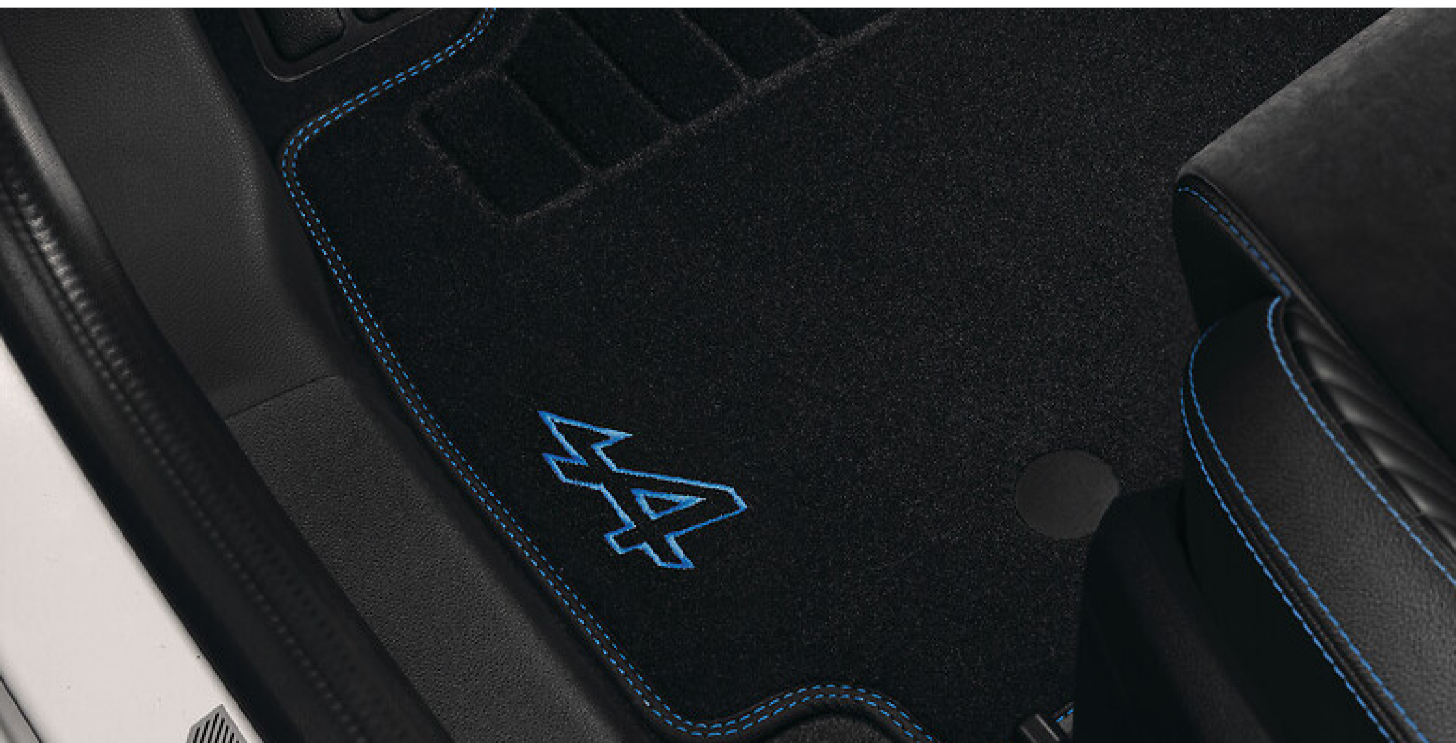
tapete textil HEV GD KO ref.: 749M67052R

Protege cada detalle de tu vehículo desde el interior con las alfombras textiles marcadas con el emblema esprit Alpine.