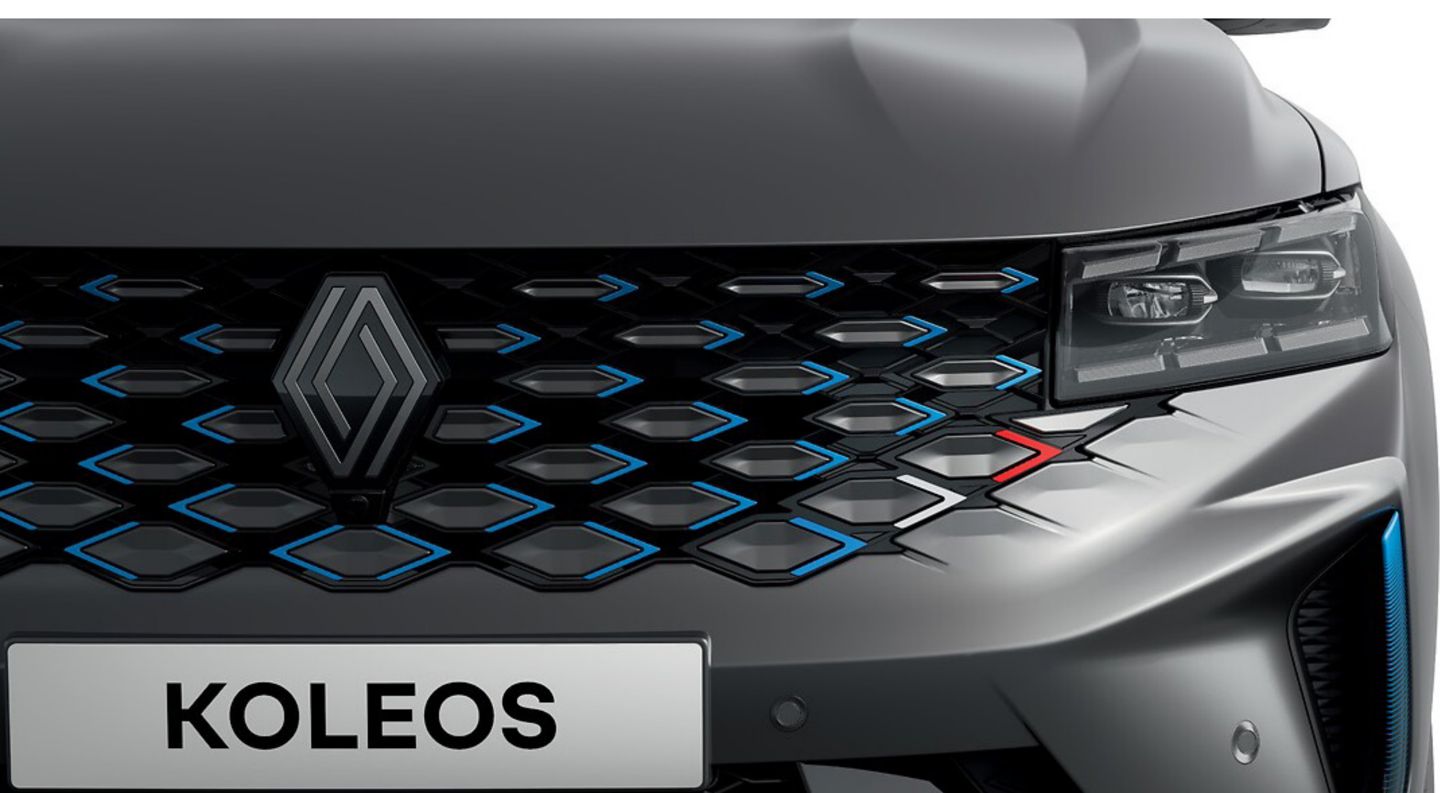
deco parrilla FR GD KO ref. 7711805200

Resalta la elegancia francesa con este exclusivo detalle decorativo para la parrilla delantera. Inspirado en los colores emblemáticos de Francia, este accesorio aporta carácter, identidad y un toque distintivo al diseño de tu vehículo.