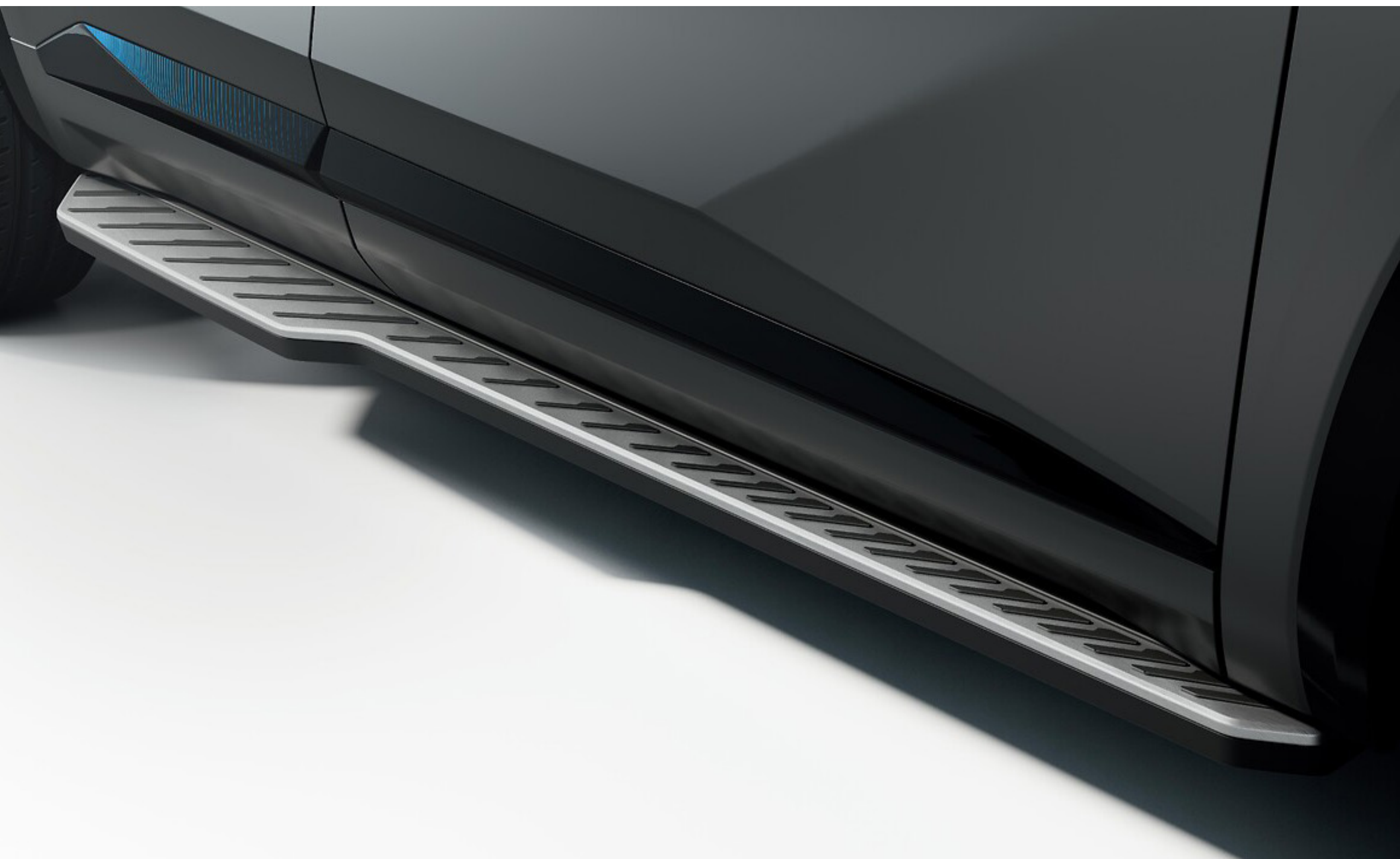
kit estribos laterales GD KO ref.: 961003454R

Para recorrer los caminos más salvajes y abrazar un estilo de vida más aventurero, prácticos estribos que facilitan el acceso al vehículo y al techo mientras protegen la carrocería de los golpes menores diarios.