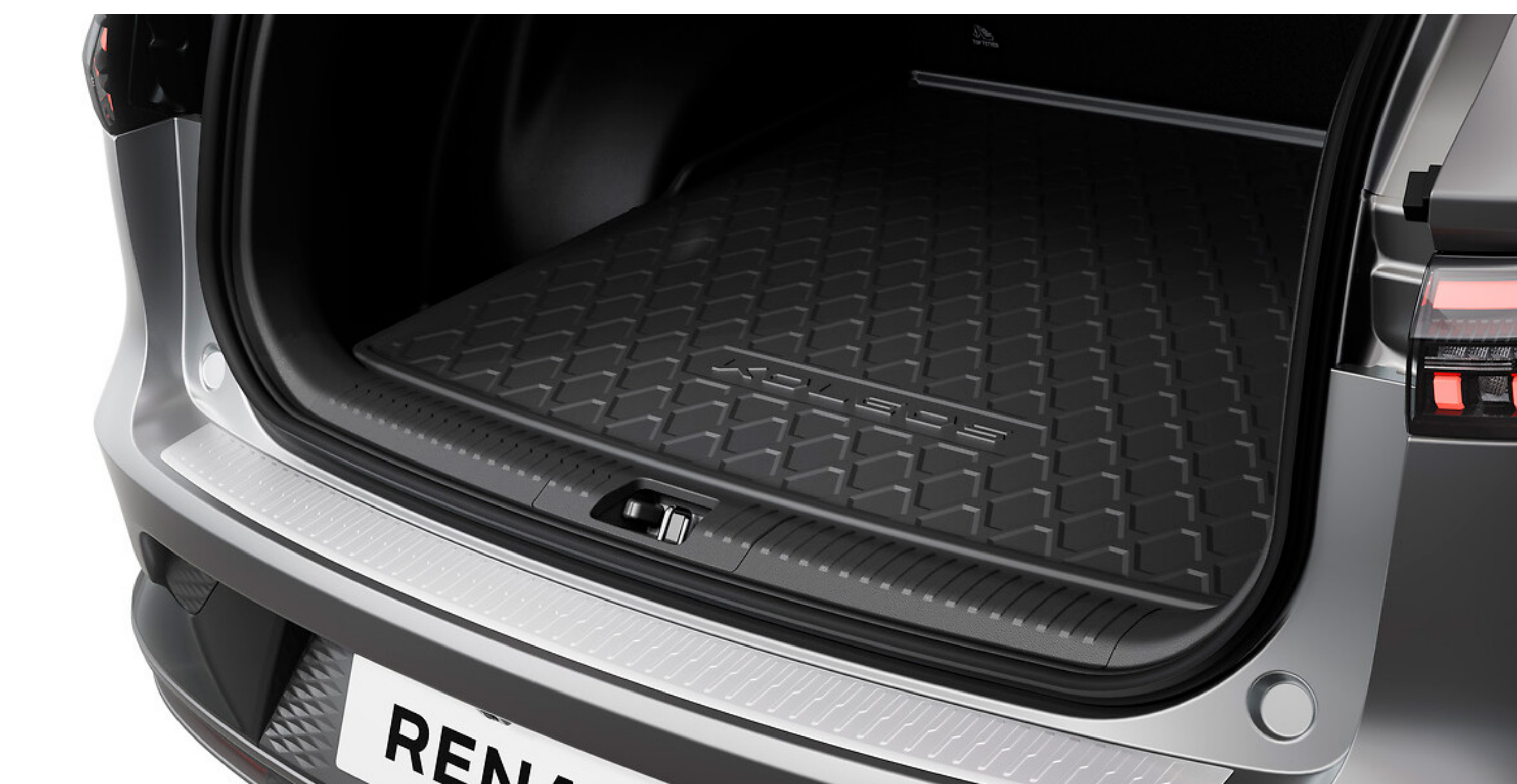
tapete baúl GD KO ref.:749L08754R

Ideal para transportar todo lo que necesitas para viajar contigo, en especial objetos sucios. Protege eficazmente el tapiz original y se adapta perfectamente a la forma del baúl. Práctico y fácil de instalar y limpiar gracias a su material flexible.