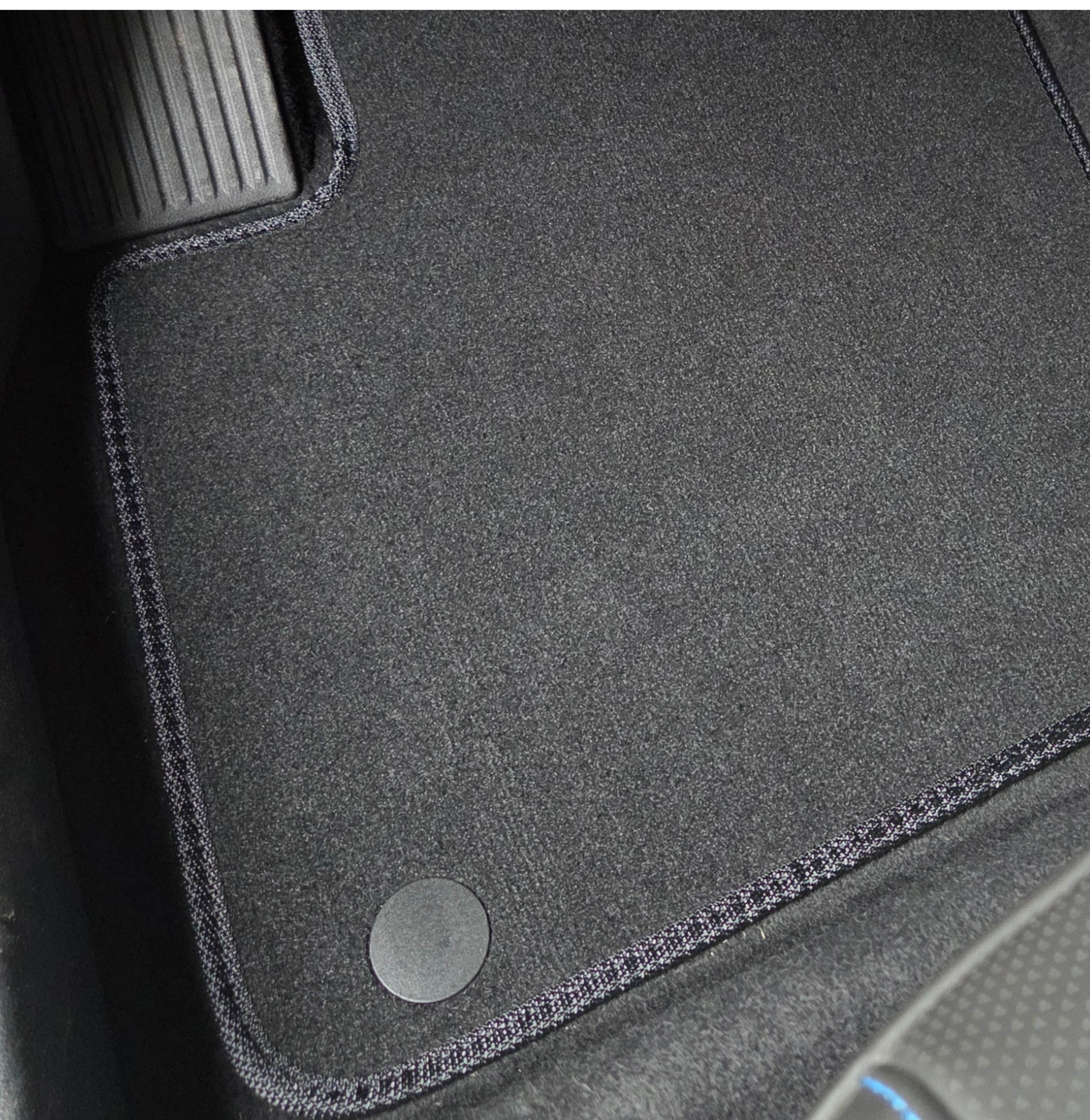
tapete textil ICE GD KO ref.: 749003058R

Alfombra 100% polipropileno punzonado color negro, base de caucho antideslizante y todas las normas de seguridad.